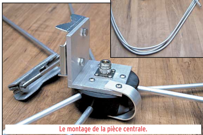
Le montage de la pièce centrale.

Wheel. Deux de mes amis, qui en possèdent une du modèle présenté ici, ne me contrediront pas: avec de la propagation, on fait du DX sur cette antenne! De plus, il est même possible de recevoir avec de bons résultats et, étonnamment, quasiment pas de perte de signal, les satellites météo défilants sur 137 MHz!