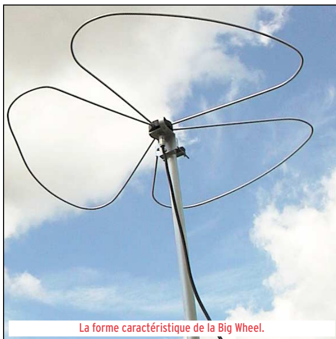
La forme caractéristique de la Big Wheel.

Cette antenne va raviver des souvenirs chez les plus anciens d'entre nous, ceux qui trafiquaient en VHF dans les années 70 en BLU ou en AM, quand les relais FM n'étaient pas encore au goût du jour... La Big Wheel est une antenne omnidirectionnelle, à polarisation horizontale, qui mérite d'être installée en complément d'une antenne rotative... ou seule quand on ne peut faire mieux!