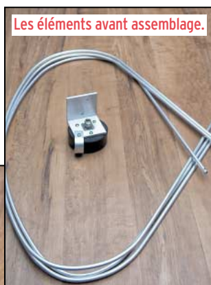
Les éléments avant assemblage.

sens pour trouver une station... Parfois, on peut même faire le contact sur la Big